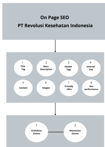
Gambar 1 Tahapan Metodologi Penelitian

Penelitian ini berfokus pada algoritma google panda, maka pendekatan yang dipilih adalah teknik SEO on page . disebabkan oleh karakteristik algoritma google panda yang menekankan pentingnya kualitas konten dan relevansi kata kunci dalam struktur halaman website. Algoritma ini dirancang untuk menilai dan memberikan peringkat yang lebih tinggi kepada halaman yang memiliki konten berkualitas tinggi dan relevan, serta optimasi on page yang baik. Oleh karena itu, dalam penelitian ini, penulis akan memfokuskan pada optimasi elemen on page , seperti penempatan kata kunci yang strategis, pembuatan deskripsi yang informatif, dan penggunaan tag yang tepat, guna meningkatkan peringkat website sesuai dengan kriteria algoritma google panda [9].